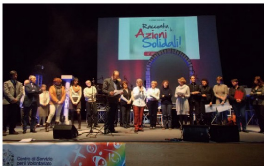
Due immagini del concerto dell'anno passato

In occasione dell'evento saranno inoltre premiati i vincitori dei concorsi "Racconta le Azioni Solidali Vi-