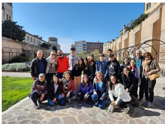
Nella foto: i giovani durante la giornata di partecipazione del 1° aprile.

Questo però è stato solo il primo passo. I ragazzi e le ragazze della Consulta si sono già impegnati a stilare, con le loro organizzazioni, un regolamento costitutivo e un calendario di incontri ai quali saranno presenti anche altre organizzazioni che si sono dichiarate interessate: giovani di Save the Children e le Consulte studentesche. Una serie di meeting e di incontri residenziali dove poter preparare l'incontro di novembre con il Consiglio Regionale del Veneto e altre istituzioni come l'Ufficio Scolastico Regionale e il Garante regionale dei diritti della persona del Veneto.